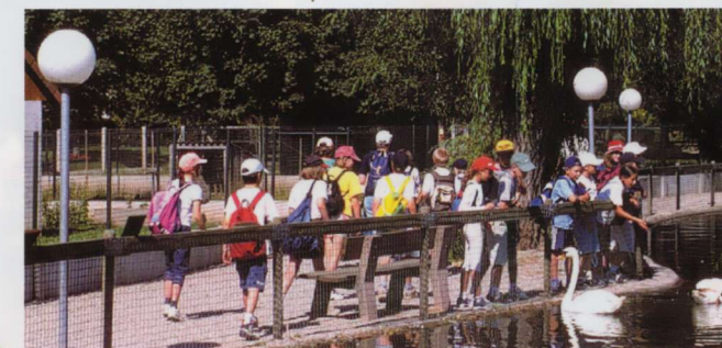
Accueil de groupes scolaires pour une visite ludo-éducative