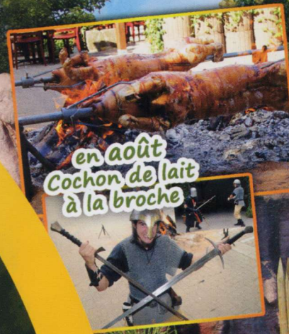
en août Cochon de lait à la broche