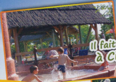
Il fait bon vivre à Cigoplage