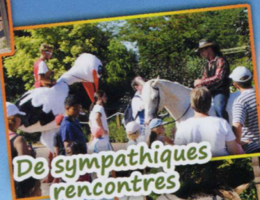
De sympathiques rencontres