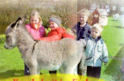
Kuschelzeit im Esel- Kindergarten