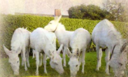
Seltene weiße Barockesel